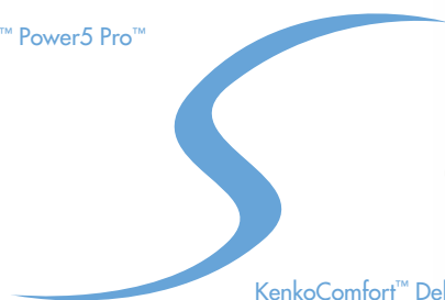
KenkoComfort™ Deluxe Matratze