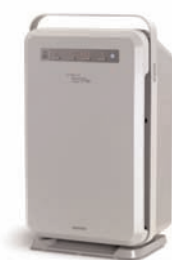
Air Wellness™ Power5 Pro™